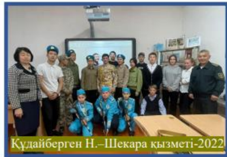
Құдайберген Н.-Шекара қызметі-2022